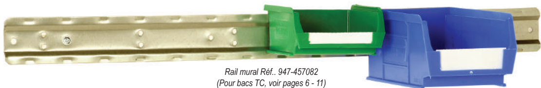
Rail mural Réf. 947-457082 (Pour bacs TC, voir pages 6 - 11)