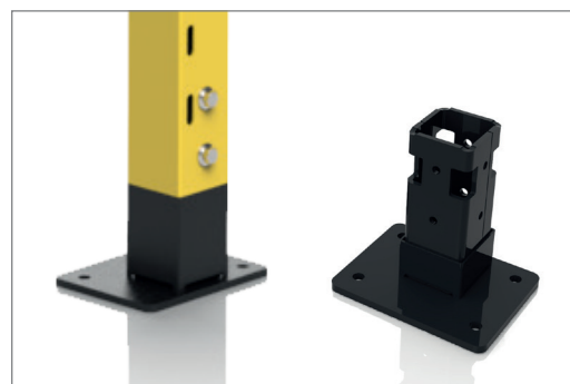
Pied Premium 70x70 mm

Le poteau Classic 50x50 est fourni avec un cache pied pour couvrir le pied soudé. Le bouchon supérieur et la vis à expansion pour la fixation au sol sont fournis. Garde au sol 100 mm.