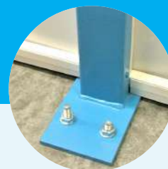
Poteau de stabilité