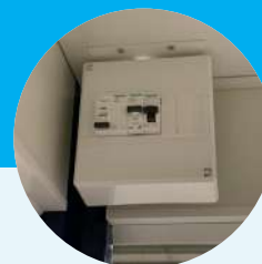
Les équipements électriques, guichet, ventilation, sont installés directement en usine