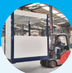
Déplaçables selon vos besoins