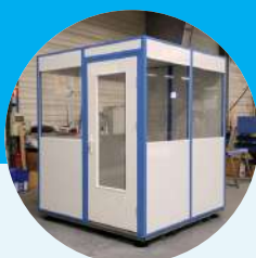
Porte simple battant vitrée