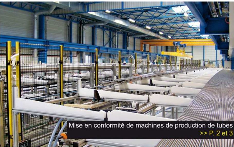
Mise en conformité de machines de production de tubes >> P. 2 et 3